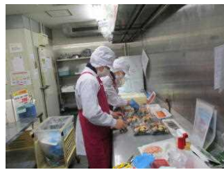
マックスバリュ男鹿店より