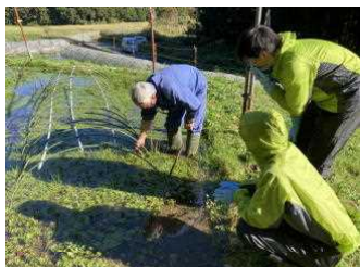
滝の頭クレソンより